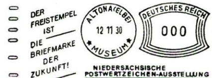
KOMUSINA TYPE E-1/Ko