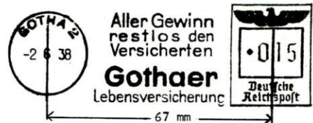
FRANCOTYP MASCHINE "D" TYPE E-5