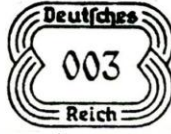
E-4/ SAARTYPE FRANCOTYP D.R.