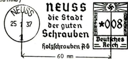
FRANCOTYP MASCHINE "A" TYPE E-3

DIE MASCHINEN-TYPEN (BEI FRANCOTYP MIT AXSEN- ABSTAND)