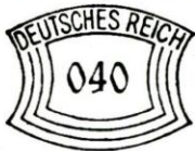
E-1 BOGENRECHTECK FRANCOTYP