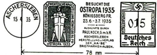
FRANCOTYP MASCHINE "C" TYPE E-3